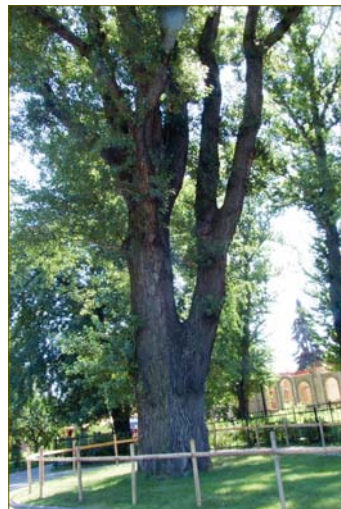
Тополь в Гидропарке. Самый старый тополь Киева. Возраст 120 лет, высота 20 м, обхват ствола 5,5 м. Находится в Гидропарке возле каплицы. Взят под охрану в 1999 г.