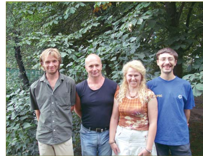
Коллектив Киевского эколого-культурного центра