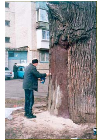
Лечение дуба Крестера

Друзья, если вы обнаружили в Киеве еще не взятое под опеку вековое дерево (безоговорочному заповеданию подлежат дубы и тополя, имеющие на высоте 1,30 м обхват ствола больше 4 м, а также буки, липы, клены, ясени, каштаны, акации, вязы, сосны, имеющие обхват ствола более 3 м) — сообщайте нам по адресу: 02218, Киев, ул. Радужная, 31-48, КЭКЦ, по эл. почте: kekz@carrierg.kiev.ua, по тел. 443-52-62, 8-067-715-27-90. Желаящие познакомиться с вековыми деревьями Киева поближе, могут посетить фото-галерею «Замечательных вековых