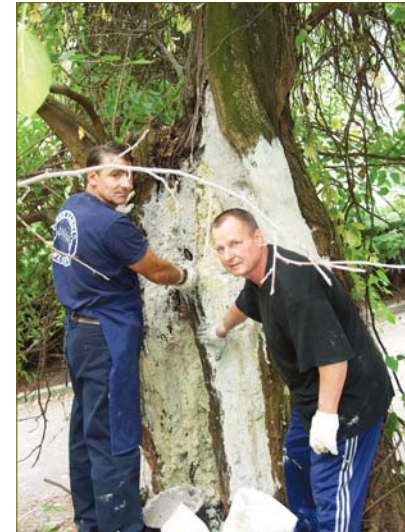
Лечение шелковицы Шевченко

деревьев Киева» на нашем сайте www.ecoethics.ru