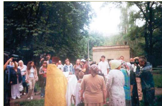
Освящение вековой белой акации

Каждое вековое дерево принципиально уникально и неповторимо. Торо говорил, что когда рубят живое дерево, в этом есть что-то почти трагичное, ибо оно становится «все-го лишь древесиной».