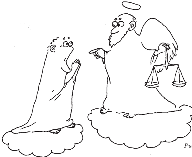
Рис. Э.Д. Шукурова

— Исповедовал ли ты экологию? Благоговел ли ты перед жизнью? Сотрудничал ли ты с журналом Гуманитарным экологическим?