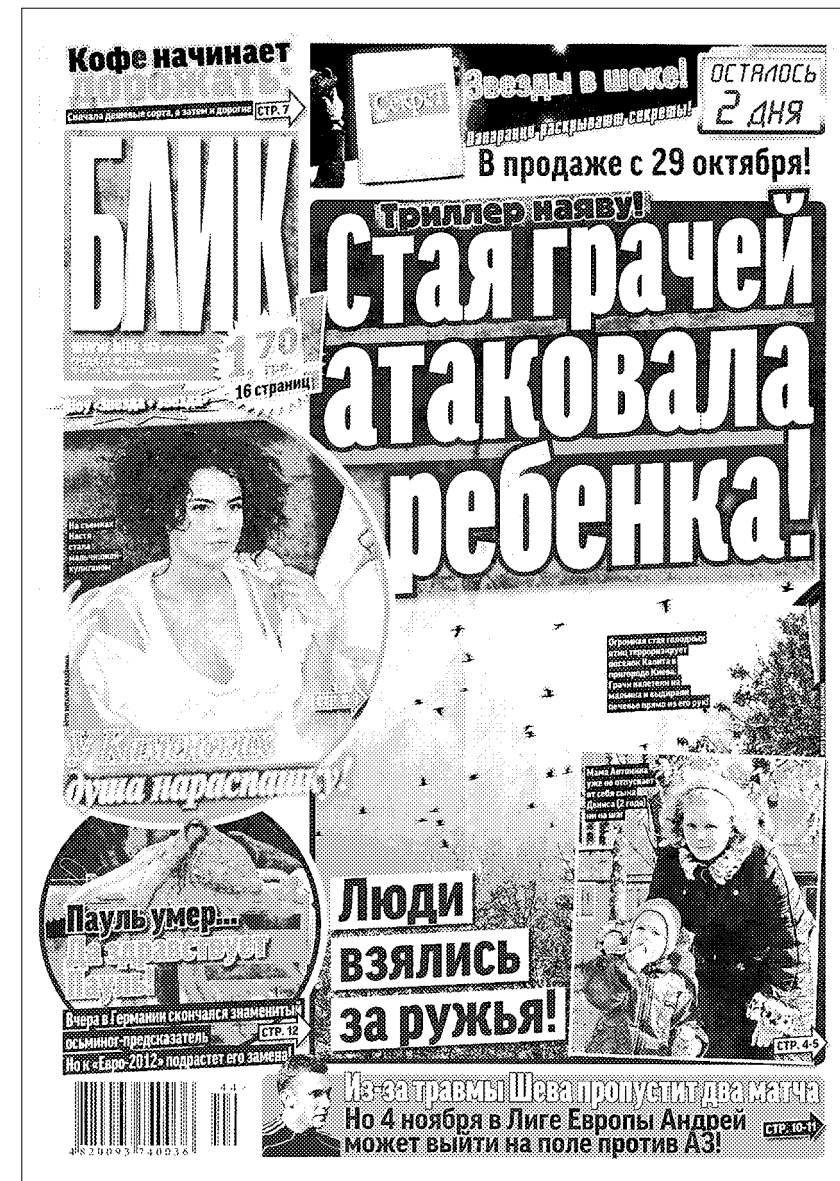
Киевская газета «Блик» — лидер среди украинских СМИ в разжигании видowego террора

Известной формой терроризма, в том числе и видowego, является «зачистка» территории. Видовой терроризм предполагает полную «зачистку» отдельных территорий — охотничьих и рыб-