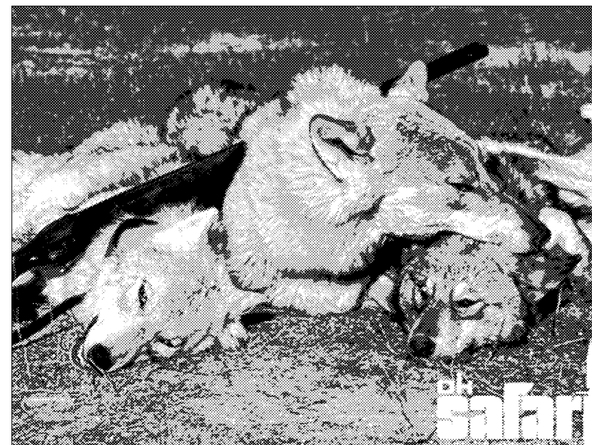
Волки — один из основных объектов видовой терроризма

В России волк издавна считается «вредным» животным и стоит вне закона. В 1943 г. в России был начат отстрел волков с самолетов, а в 1958 г. объявили конкурсы областей по уничтожению волка, были учреждены специальные премии и переходящие вымпелы Главохоты РСФСР, с 1960 г. стали применять новый яд — фторацетат бария. С 1946 по 1970 гг. в РСФСР было уничтожено полмиллиона волков. Это злодеяние и по сей день лежит на совести российских охотоведов. Волкам не было и нет сейчас спасения даже в некоторых заповедниках. В 1948 г. в 15 заповедниках СССР (в основном российских) был убит 151 волк. С середины 1930-х по 1970-е в 12 заповедниках России и Украины было уничтожено 1784 волка. В Окском заповеднике с 1937 г. по 1970 г. уничтожено 335 волков, в Кавказском — с 1938 по 1963 гг. — 510