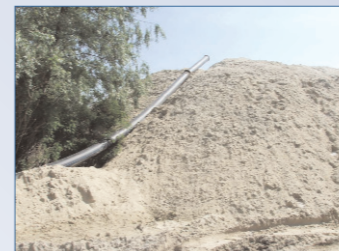
Незаконная добыча и продажа (кража) песка песочными браконьерами в заказнике Жуков остров в Киеве

Во всех областях, даже в самом Киеве, существуют десятки фирм, занимающихся незаконной добычей и продажей песка в пойме Днепра, Десны и других рек. Добывая