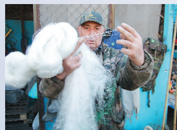
На многих рынках Украины ведется свободная продажа браконьерских сетей (г. Донецк)

Ярким примером, подтверждающим бездействие властей и природоохранных органов (прежде всего рыбинспекций), является свободная продажа браконьерских снастей — лесочных сетей, неводов, драчей, «пауков», а также капканов на 600-х рынках страны, в сотнях охотничьих, рыболовных и спортивных магазинах.