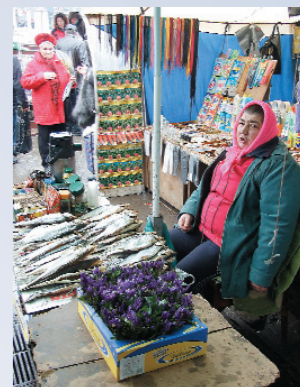
Незаконная продажа краснокнижных первоцветов в Киеве

В Крыму цветочные браконьеры объединены в цветочную мафию, занимающуюся сбором и сбытом первоцветов в Россию и крупные города Украины.