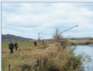
Огромные браконьерские орудия — «пауки» — открыто действовали весь год на реке Рось в Каневском районе Черкасской области

Ежегодно в Украине задерживается около 100 тыс. нарушителей Правил рыболовства. Причем их количество постоянно растет: в 1966 г. в Украине было задержано 15 тыс. рыбных браконьеров, в 1975 г. — 30 тыс., в 2007 г. — 96,6