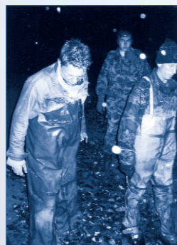
Электроудочки задержаны на горячем, Харьковская область

Массовому распространению браконьерства способствует такая широко распространившаяся в последнее время черта как воровство. Несмотря на то, что Украина — православная страна, и воровство — грех, среди широких слоев населения воровство не считается серьезным проступком. «Если не мы выловим рыбу, то ее выловит кто-то другой», — так оправдываются часто браконьеры.