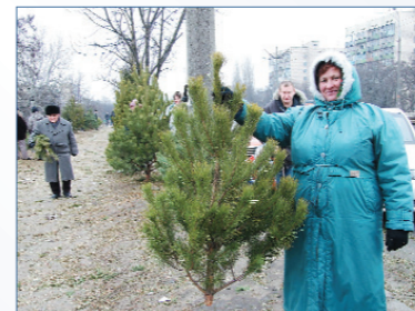
Елочные браконьеры, сбывающие хвойные деревья, вольготно чувствуют себя даже в Киеве

Экологические инспектора иногда пломбируют механизмы по незаконной добычи песка, однако песочные браконьеры на следующий день нагло срывают пломбы и продолжают незаконный промысел. Как правило, земснаряды для добычи песка изготавливаются браконьерами самостоятельно, регистрационных документов (как плавсредства) не имеют, обычно у них нет никаких документов и на добычу песка. За день такой земснаряд нарывает до 200 тонн песка, на чем зарабатывают до 5 млн. гривен в месяц. Только в Киевской области в 2008 г. песочные браконьеры нанесли ущерб рыбным запасам в 3 млн. гривен, а возмещено ими было всего 970 тыс. гривен.